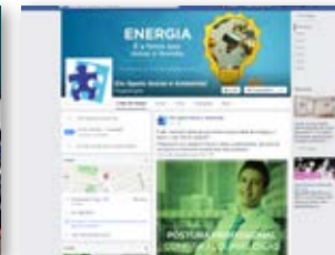
Página no Facebook – 150 postagens ao longo do ano e mais de 3.600 pessoas curtindo a página