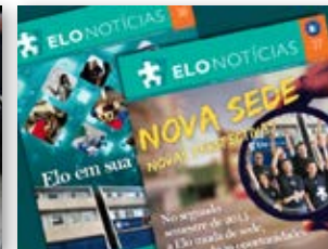
Jornais Elo Notícias – duas edições produzidas e enviadas às empresas e parceiros