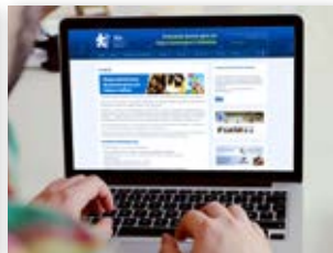
Novo site Institucional e novo portal do Aprendiz