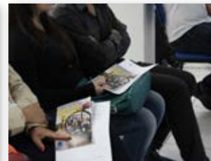
Materiais diversos de divulgação