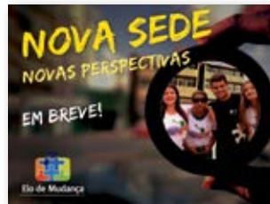
Materiais referente à Mudança de Sede

Confira algumas ações de comunicação colocadas em prática como forma de dar visibilidade ao trabalho e dar suporte às atividades: